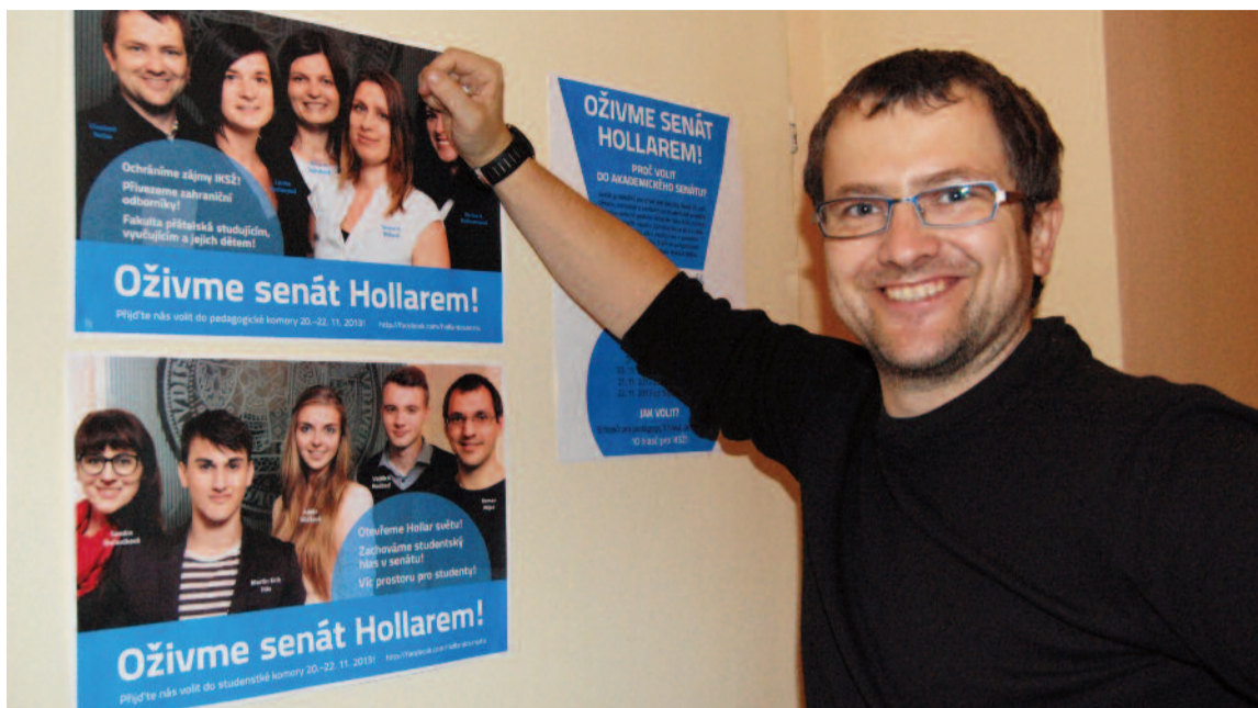
Kandidát do akademického senátu FSV UK