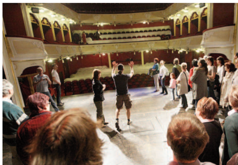
Taky pardubické divadlo bude otevřeno pro návštěvníky.