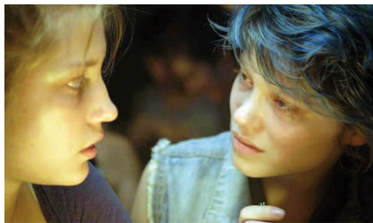
Herečky Adele Exarchopoulos a Léa Seydoux