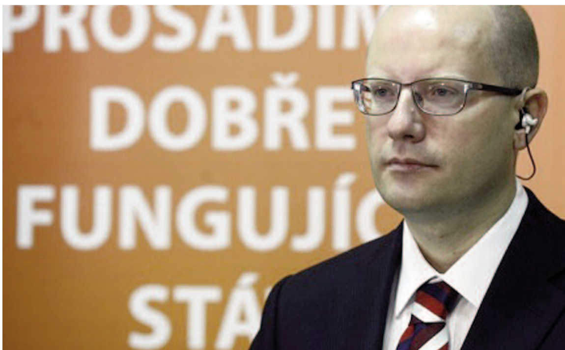
Bohuslav Sobotka povede vyjednávání o sestavení vlády.

Na zasedání dorazilo přibližně 180 straníků včetně Michala Haška, který prohlásil: „Já jsem přišel, protože nejsem zbabělec, aby lidé viděli, že se nebojím a neutíkám od odpovědnosti.“ Zároveň s Jeronýmem Tejcem prohlásil, že nadále chtějí být pouze řadovými poslanci.