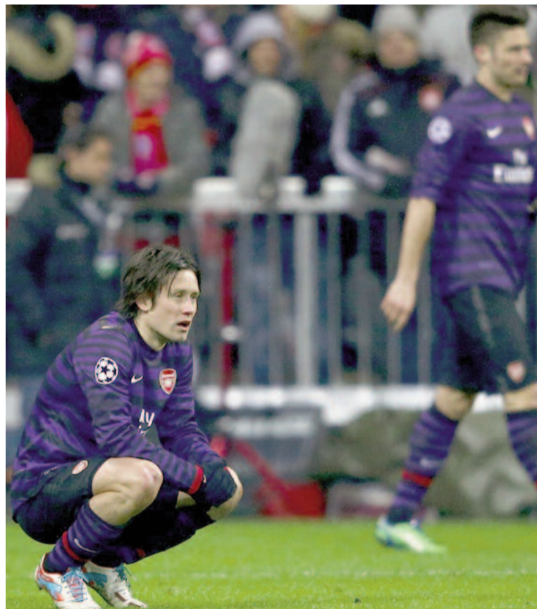
Zklamání Tomáš Rosický po vyřazení Arsenalu.