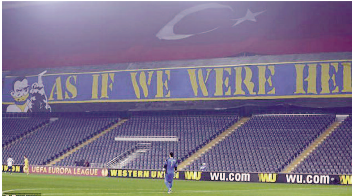
Jako kdybychom tu byli. Po fanoušcích Fenerbahçe zůstane na tribunách jen transparent.