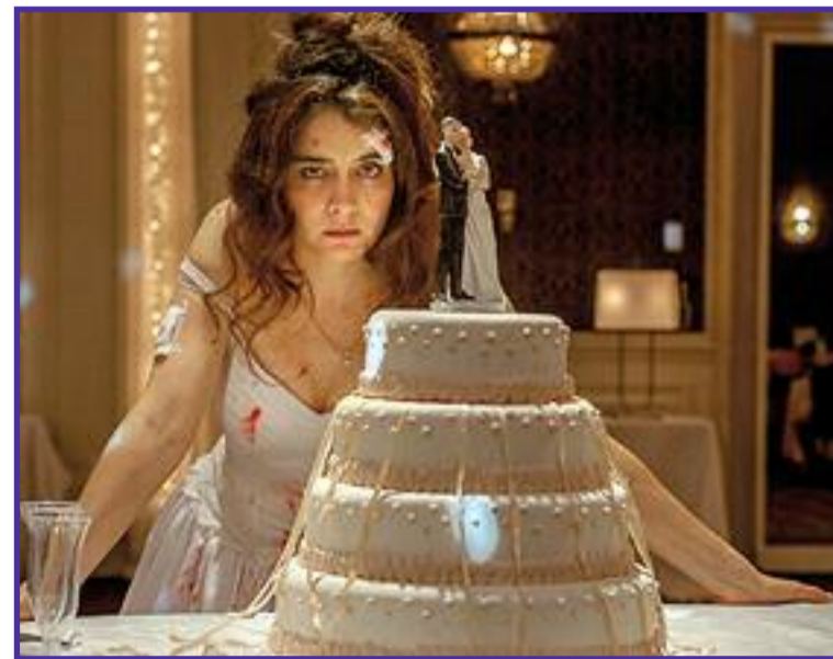
Záběr z filmu Divoké historky.