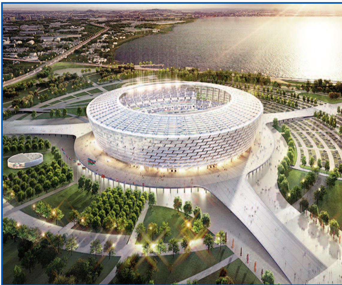
Nový stadion v Baku (USSR)

Základním problémem je, že v Česku nemáme dostatečně velký stadion. UEFA rozhodla, že minimální kapacita pořadatelského stadionu bude 40 000 míst, následně však snížila své rozhodnutí na 30 000 míst, aby mělo šanci více