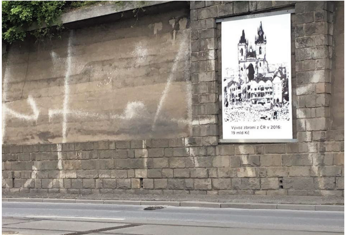
Jeden z obrazů na zdi Letenských sadů