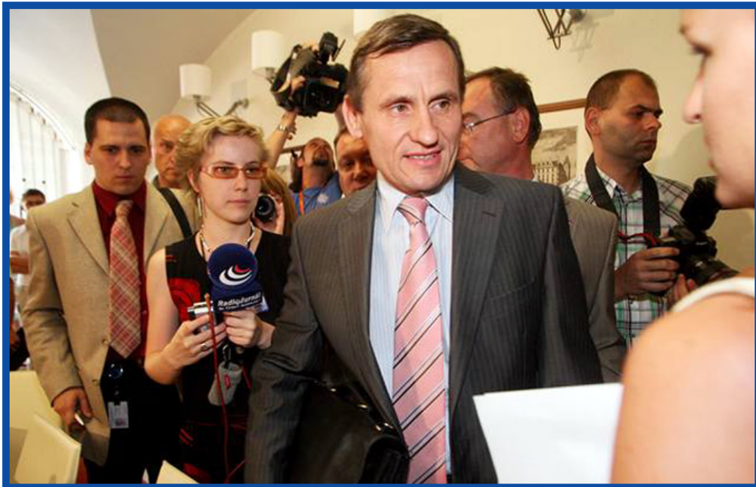
Zástupy novinářů v předsálí jednací síně jsou zůženy o televizní štáby.