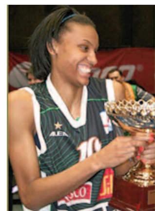
Titul je zpátky v Brně.

Nedůraz v závěrečné čtvrtině stál Pražanky vítězství v prvním i druhém utkání. Moravanky tak za stavu 2:0 na zápasy mohly doma definitivně rozhodnout, klub USK ale ukázal svou sílu a v napínavém duelu urval těsnou výhru 78:74. „V neděli jsme ne-