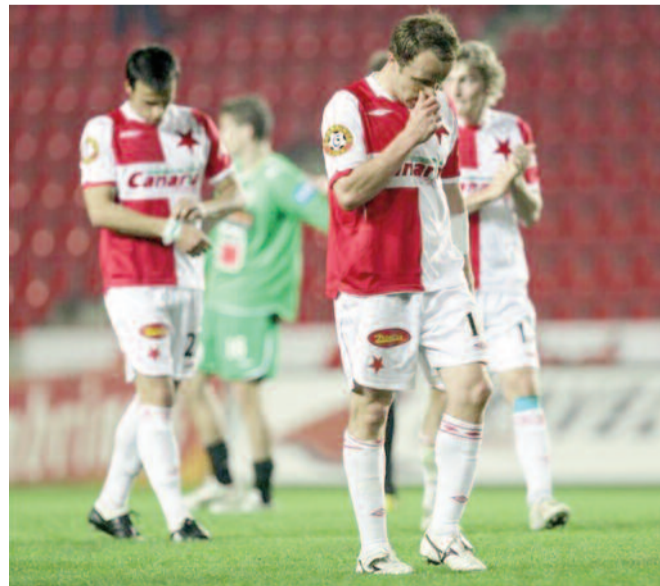
Zmar Slavia si navíc na titul nesáhne ani v lize.