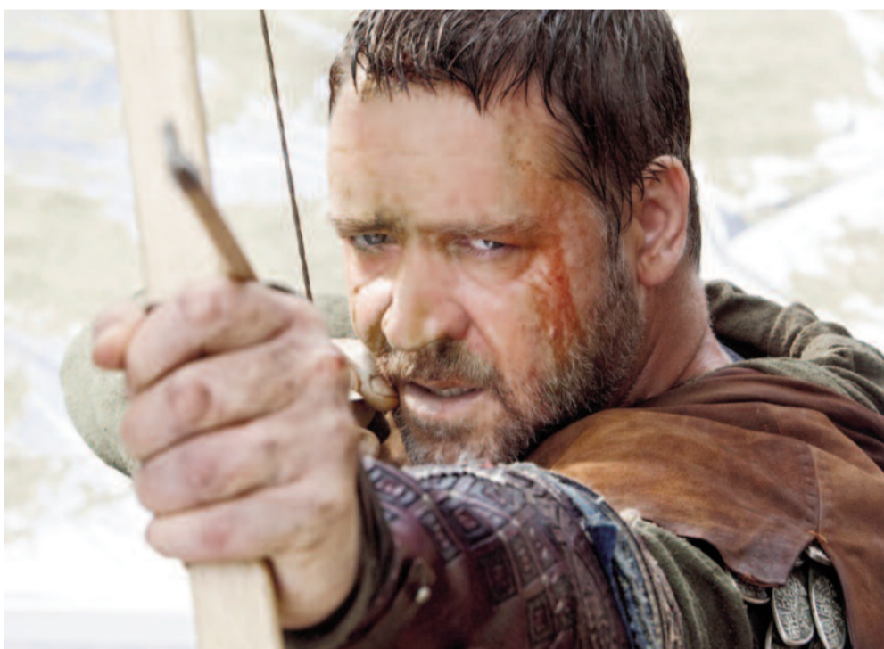
Mdlý bojovník. Russell Crowe jako Robin Hood nepřesvědčil.

Navzdory těmto jedinečným zkušenostem nyní s realizací středověké legendy povážlivě narazil. Došly mu originální nápady. Příběh o zrodu nejslavnějšího zbojníka zhistorizoval a pojal spíš jako spletité intriky a spory mezi anglickým trůnem a francouzským panovníkem. V rámci dlouholeté historie Robina Hooda, čítající nespočet literárních podob a desítky filmových zpracování, je nutné, aby se každý další něčím odlišo-