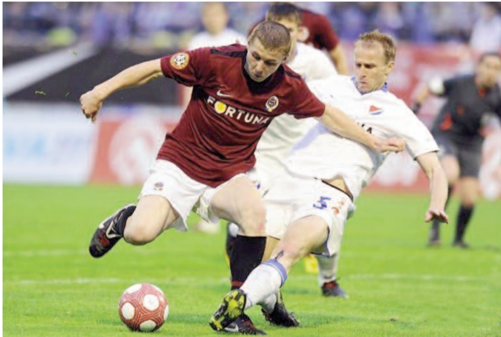
Sobotní fotbalové drama. O titul se na dálku přetahují hned tři týmy.

Pořadí v tabulce přitom ještě mohou pořádně zamíchat čtvrté Teplice, které se v sobotu odpoledne na Letné utkají právě s vedoucí Spartou. Pokud ji oberou o body, k titulu bude mít blíže Baník, jenž má relativně snadnější los – jede na půdu deváté Příbrami. Jablonečtí by k zisku ligového primátu potřebovali kromě domácího vítězství nad Českými Budějovicemi i zaváhání obou svých soupeřů z čela tabulky.