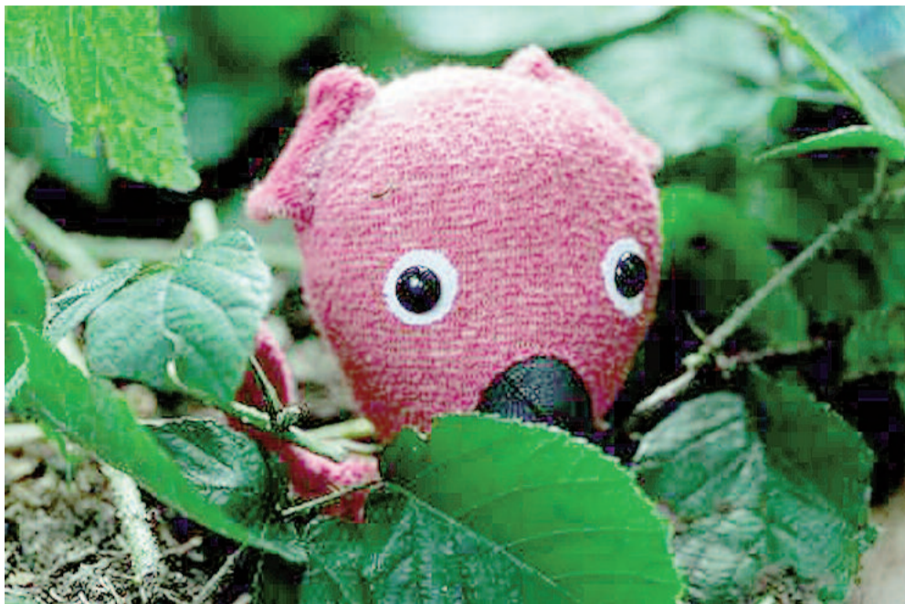
Návrat Kukyho. Růžový plyšák se vrací ze smetiště domů.

K uky je růžový plyšák, oblíbenec malého Ondry. Sedává na poličce a v noci spí s Ondrou v posteli. Jenže Ondra má astma, a tak musí Kuky pryč. S tím se Ondra nehodlá smířit a jeho fantazie začne pracovat naplno. Kuky se objeví na skládce, odkud uteče do lesa. Tam potkává hodné (kapitán von Hergot) i méně hodné (Pytlíci) lesní tvory a snaží se najít cestu domů. Během života v lese se z mazlíka, který se „nesmí namočit, protože má v sobě piliny a dlouho schne“, stává hrdina. A zda se vrátí domů? To je otázka, na kterou si musí najít odpověď každý sám. Kuky se vrací je odpočinková, milá pohádka pro děti i dospělé viděná perspektivou mikrosvěta. Loutky se na plátně střídají s lidmi i zvířaty. Nechybí dojemné ani akční scény. A divák se v té neobvyklé pohádce nachází - dětství si pamatuje každý. I režisér Jan Svěrák a další tvůrci snímku.