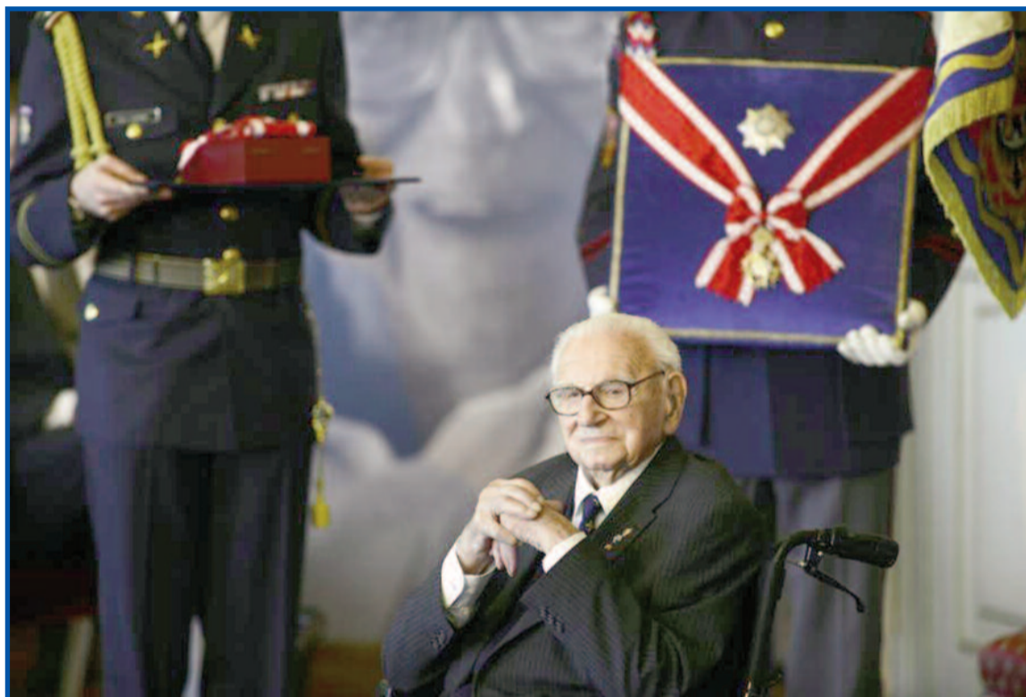
Sir Nicholas Winton se konečně dočkal.