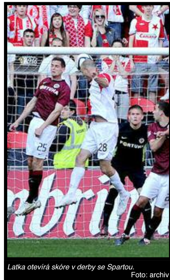
Latka otevírá skóre v derby se Spartou.