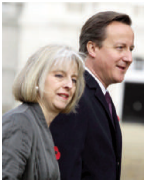
Ministryně Mayová a premiér Cameron

LONDÝN – „Nacházíme se uprostřed boje se smrtící teroristickou ideologií,“ varovala včera britská ministryně vnitra Theresa Mayová a předložila parlamentu návrh kontroverzního zákona zahrnujícího striktní protiteroristická opatření. V ten samý den byli za účast na teroristickém výcviku odsouzeni první dva Britové, bratři Nawazovi z Londýna.