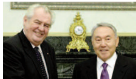
Prezidenti Zeman a Nazarbajev.