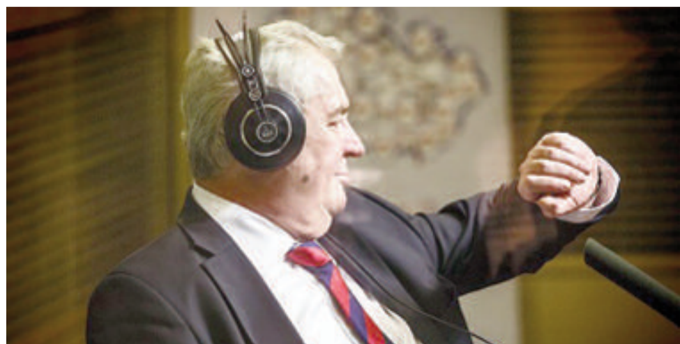
Vážený pane redaktore, už je čas na cigárko!