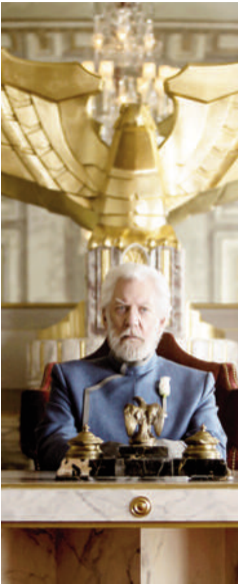
Jeho excelence prezident Coriolanus Snow

Do kin dorazila první část dlouho očekávaného třetího dílu Hunger Games: Mockingjay , úspěšné trilogie podle námětu stejnojmenné knižní předlohy.