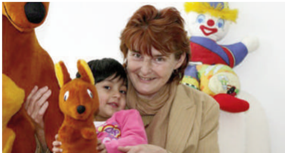
Neblbněte, v Klokánku je dobře!

Klokánek funguje jako přestupní bod péče pro děti a je osobitější alternativou té ústavní. Je tu do té doby, než se dítě může vrátit zpět do své rodiny, případně než se najde vhodný trvalý náhradní domov v podobě adoptivních rodičů nebo pěstounů. Jde o děti, které byly zanedbávány, týrány, zneužívány, nebo jim jejich rodina nebyla schopna nabídnout adekvátní prostředí