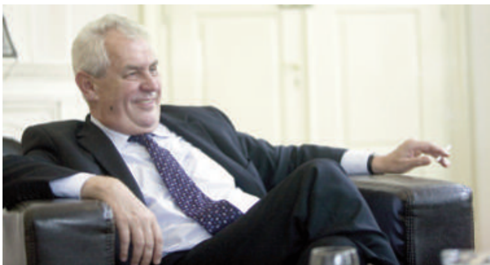
Máme pana prezidenta rádi, tak je na každé straně!