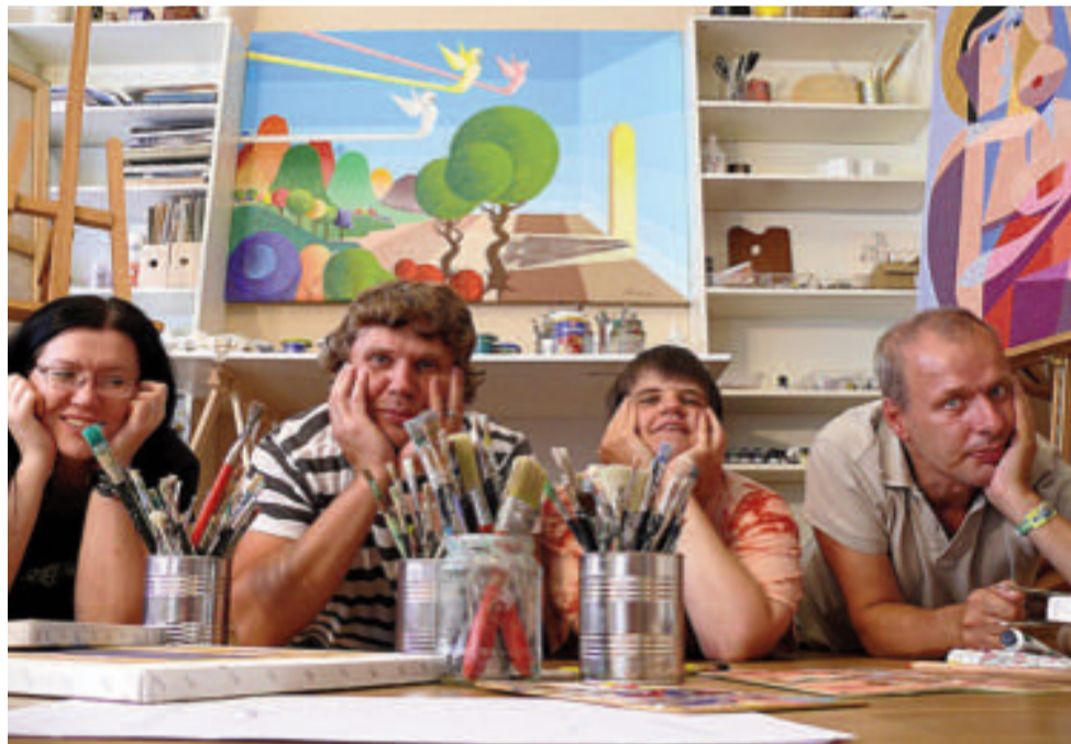
Tak kdy začneme, vážení?