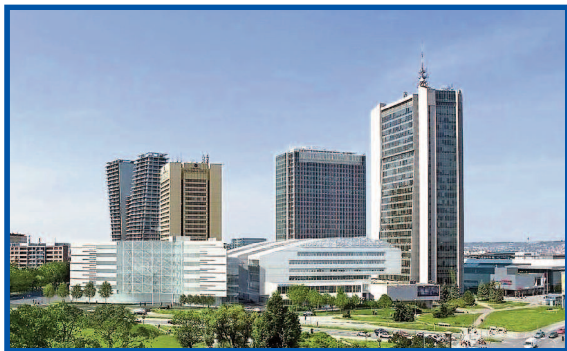
Mrakodrapy na pražském Pankráci