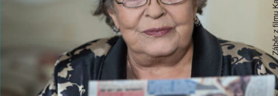
Záběr z filmu Každý milion dobrý.

Text: Martina Růžičková