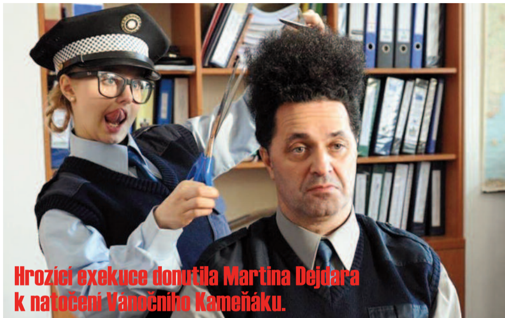
Hrozící exekuce donutila Martina Dejdaru k natočení Vánočního Kameňáku.

Herecký ansámbl se od prvních dílů výrazně proměnil, až na hlavní postavu starosty Pepana, kterého nadále představuje Václav Vydra. Kromě něj narazíme