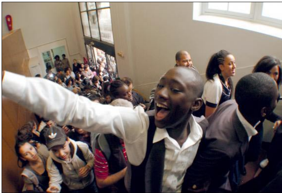
Tématika filmu oproti názvu nezustává „mezi zdi“.

Film byl natočen podle autobiografického románu bývalého učitele Françoise Bégaudeaua. Vyučující François Marin, kterého zpodobnil sám autor románové předlohy, velmi silně lpí na svém poslání. Snaží se studen-