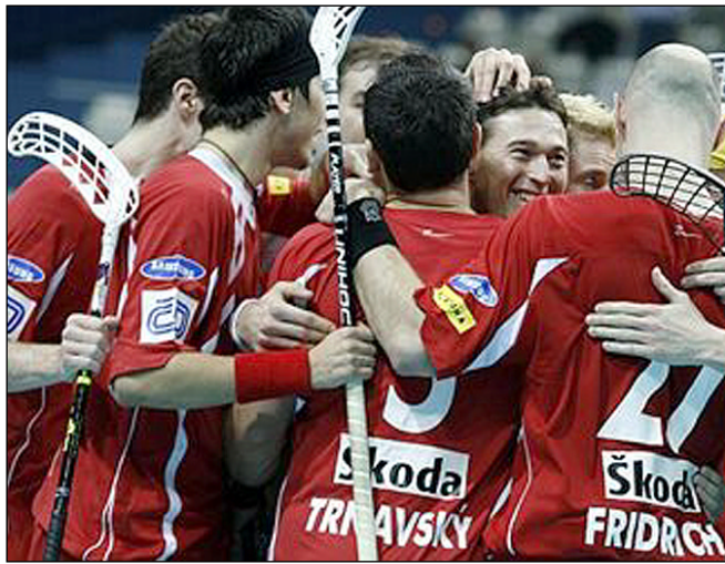
ČESKÁ RADOST. Florbalová reprezentace slaví postup do semifinále, ve kterém se utká s Finskem

Veskrze kladný. Dosáhl povinných výher nad Ruskem a Itálií, odehrál vyrovnaný zápas se Švédy a v klíčovém utkání o postup