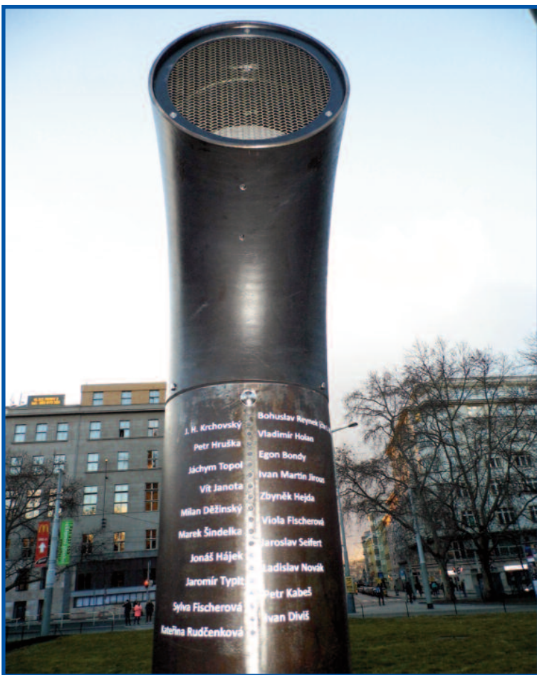
Poesiomat na náměstí Míru v Praze.