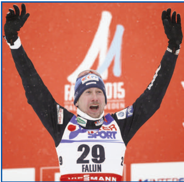
Lukáš Bauer se raduje ze stříbrné medaile.

Bauerovi vyšla sázka na riskantní výměnu lyží pouhých pět kilometrů před cílem, kdy český reprezentant jako jediný z favoritů ubul čerstvě namazané běžky, na kterých v závěrečných stovkách metrů ujel několika medailovým kandidátům. V cílové rovině pak prohrál pouze s neúspěšnějším účastníkem šampionátu Petterem Northugem, který ve Švédsku vybojoval celkem čtyři zlaté medaile: „Šel jsem do rizika a naprostě jsem překopal výměny lyží. Tu poslední, kterou jsem původně plánoval 15 ki-