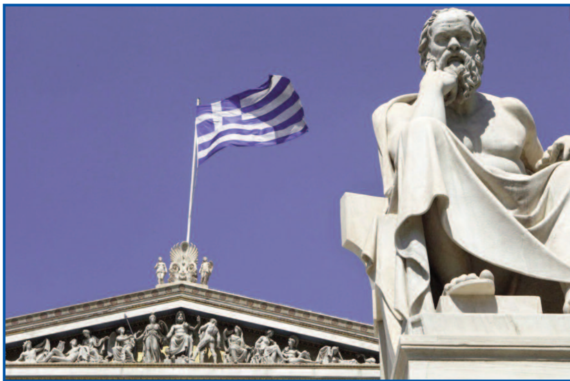
Ani Sokrates si neví rady.

Varufakis zmínil i špatné úvěry, které zatěžují rozpočty bank. Nabízí ře-