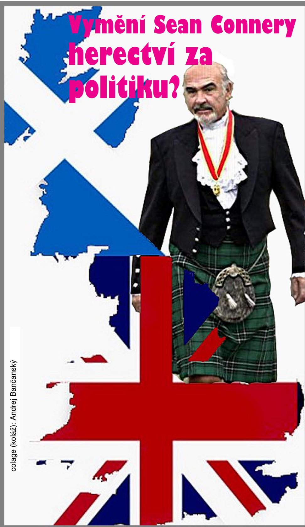
colage (koláž): Andrej Bančanský

O politickém uspořádání nového státu rozhodnou Skotové v referendu. Veřejnost je rozpolcená v otázce, zda má pokračovat monarchie, nebo vzniknout republika. Příznivci obou táborů se však shodují, kdo by měl stát v čele: populární hollywoodský herec Sean Connery. „Byla by to pro mne čest,“ uvedl pro FLY herec, kterému před devíti lety anglická královna propůjčila šlechtický titul.