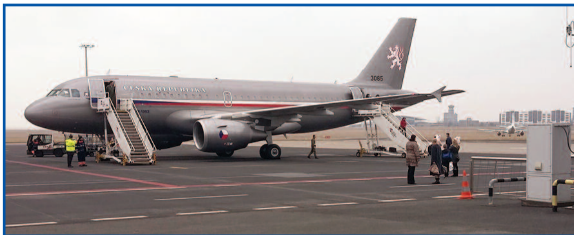
Volyňští Češi přiletěli na ruzyňské letiště.