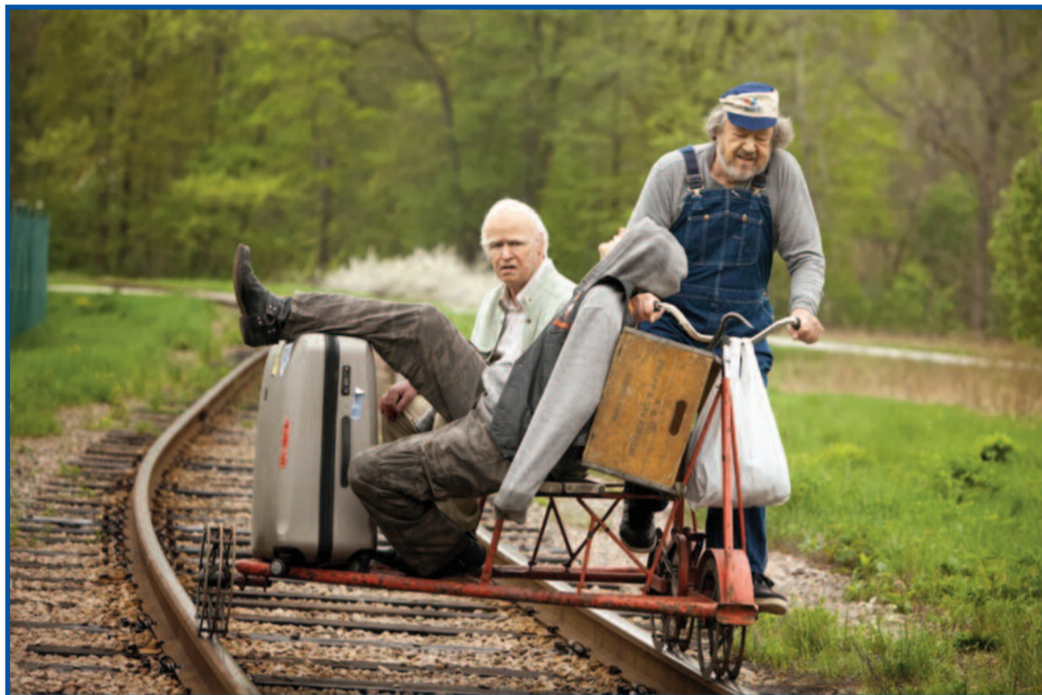
Záběr z filmu Stoletý stařík, který vylezl z okna a zmizel .

Filmovou nabídku dovršily severské snímky, které byly do kin uvedeny v posledních letech. Diváci tak mohli například shlédnout komedií Holub seděl na větví a přemýšlel o životě, drama Vyšší moc nebo filmovou adaptaci úspěšného bestselleru Jonase Jonassona Stoletý stařík, který vylezl z okna a zmizel z roku 2013.