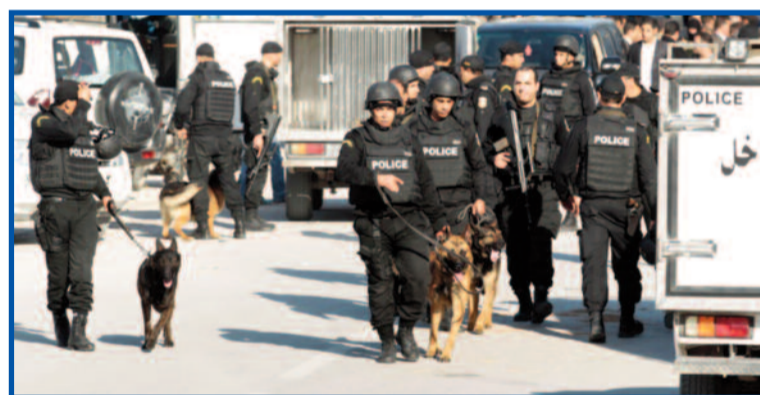
Hlídkující policejní jednotky v Tunisu.

„České cestovní kanceláře v současnosti v Tunisku žádné klienty nemají. Turistická sezóna totiž ještě nezačala,