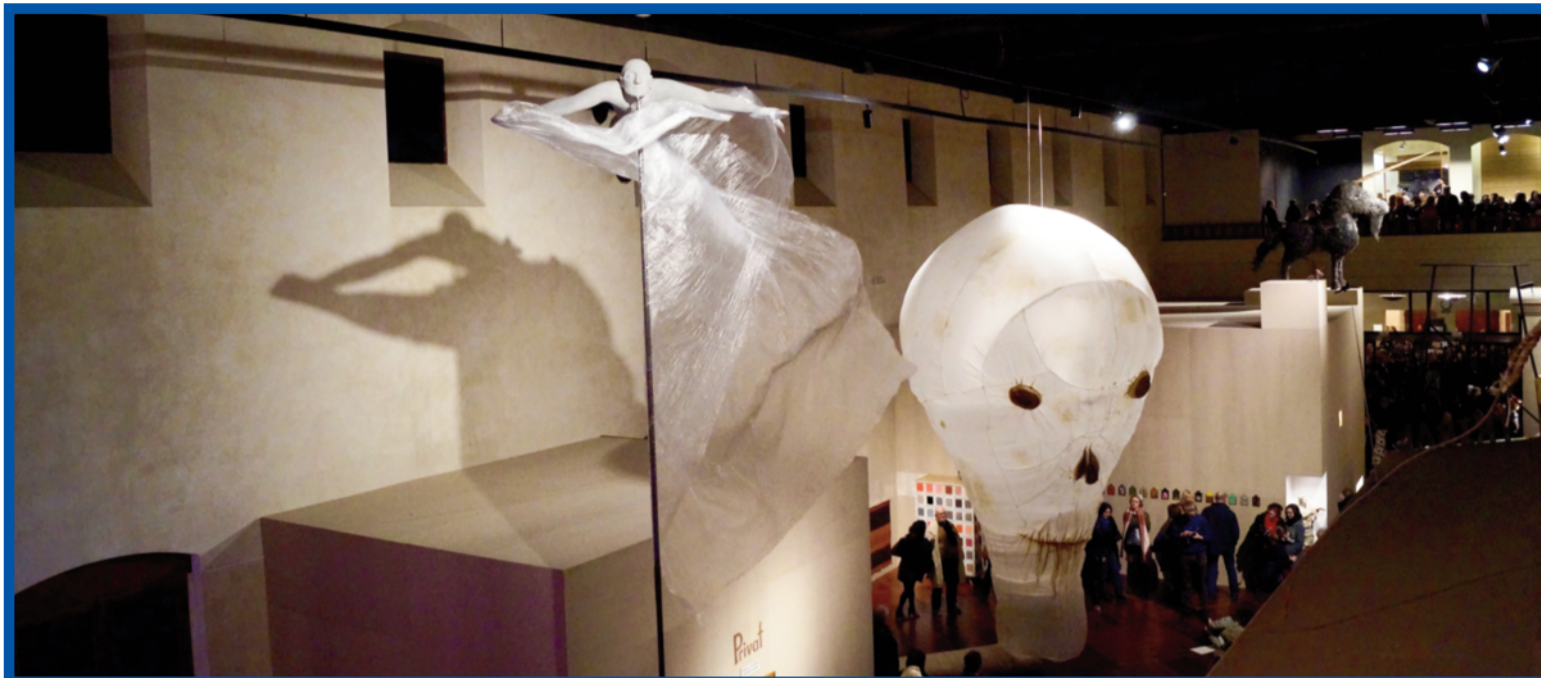
František Skála zaplnil celou Valdštejnskou jízdárnu

Prostoru dominují jednotlivá monumentální díla, jako například drátěný Jednorožec umístěný na střeše jednoho z pavilonů, nebo Zub času, velký vydlabaný kmen s pozlacenou korunou, jehož dírami můžeme pozorovat život uvnitř. Autor také vystavil některé ze svých mála mobilních soch, například Dům stínů, vyrobený z průsvitného polyesteru, na jehož stěnách se skrz světlo odrážejí objekty pohybující se uvnitř pomocí motoru. Ve svém díle Duch lebky využívá ventilátoru, pomocí kterého se obří pytel jednou za