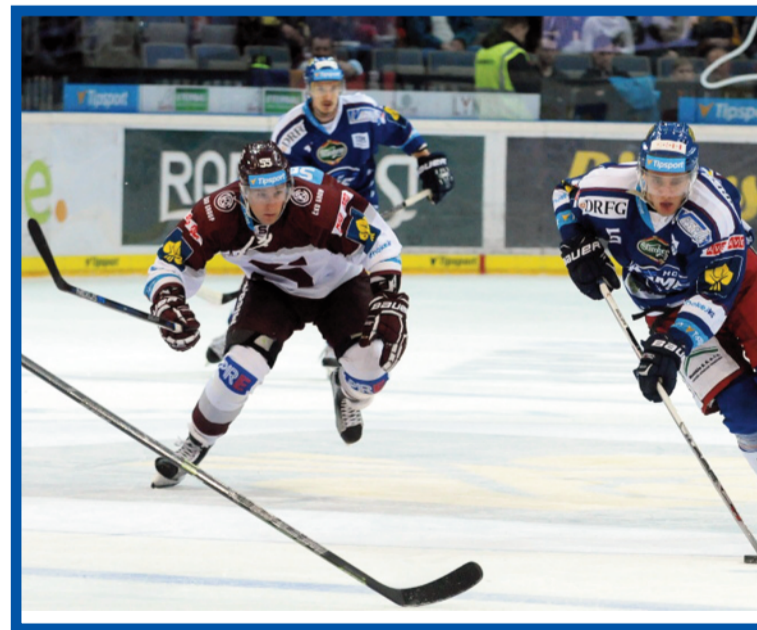
Marná snaha Sparty...