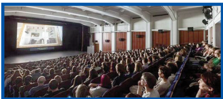
Publikum festivalu Jeden svět