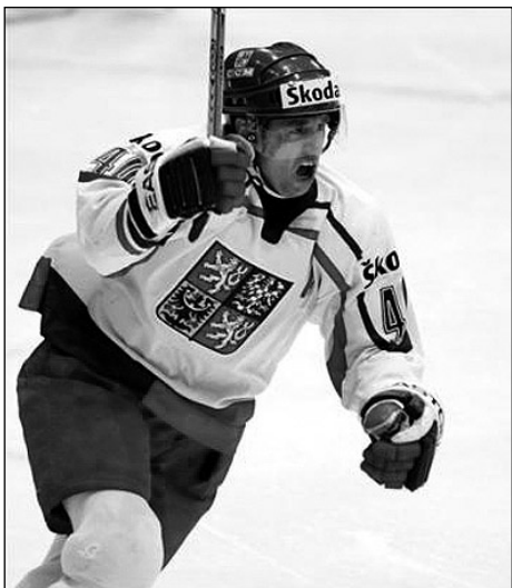
Václav Prospal v reprezentačním dresu.

pohár. Během ročníku 2004/2005, kdy se NHL nehrálo, se vrátil domů do Českých Budějovic, se kterými odehrál první ligu, a 88 kanadskými body jim pomohl k postupu do extraligy.