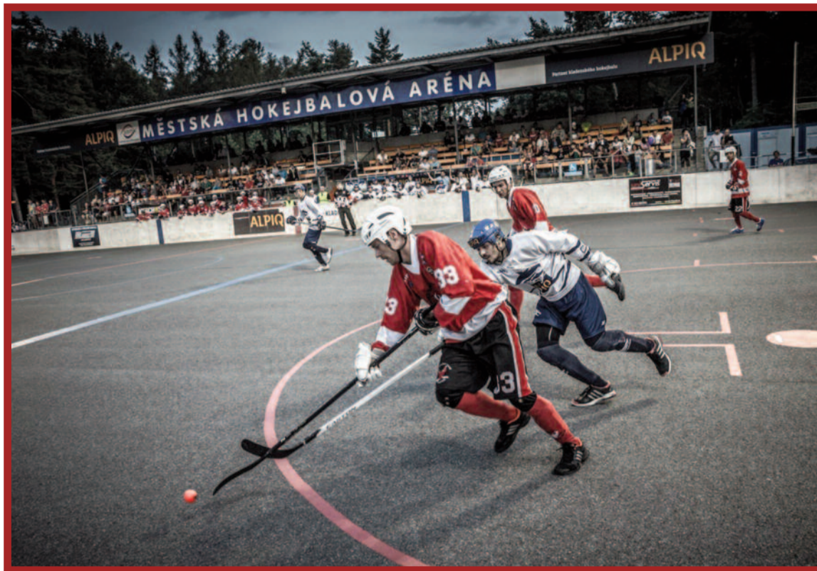
Středočeské derby přilákalo mnoho diváků.