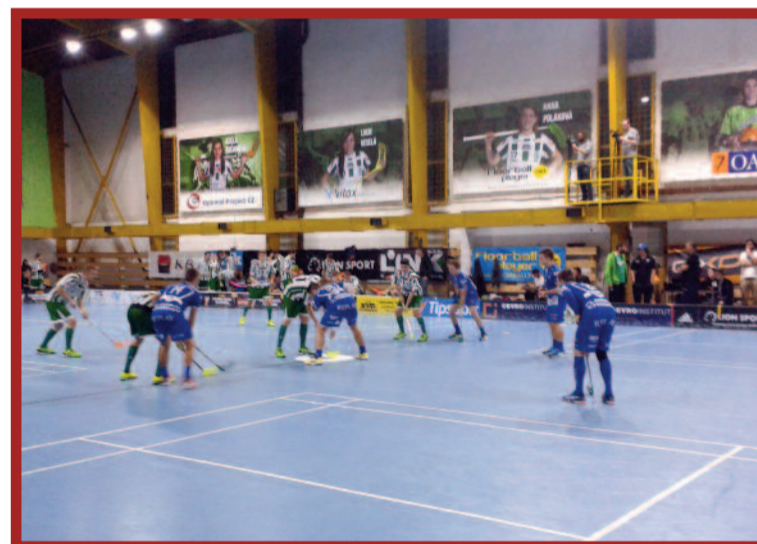
Úvodní buly zápasu