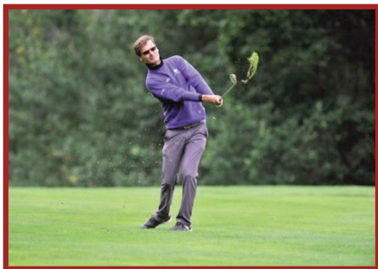
Vítěz Prague Golf Masters