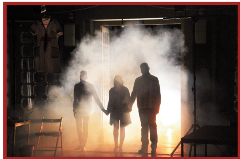
Děkovačka představení Pašije/FRAGMENTY