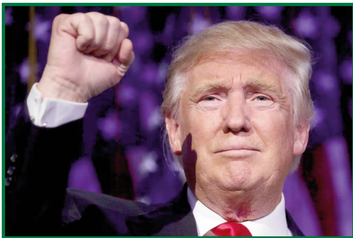
„Je čas se sjednotit. Budu prezidentem všech.“

Přestože ve všech státech Hillary Clinton i Donald Trump do poslední chvíle výrazně agitovali a ve většině z nich se přízeň nakláníla na stranu demokratické kandidátky, po úplném