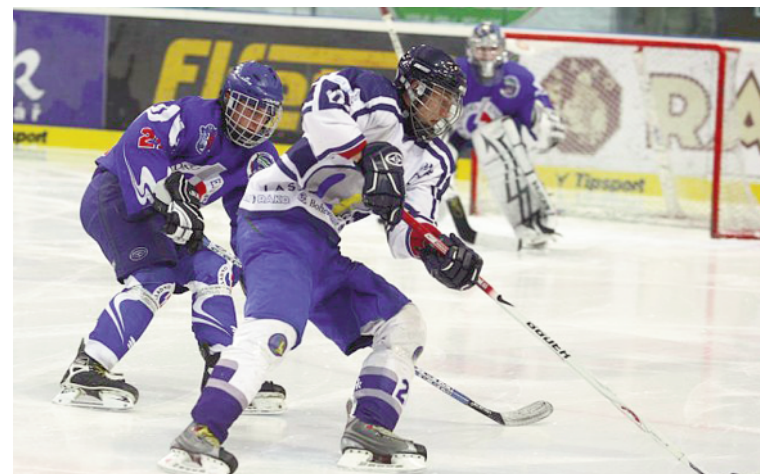
Z mladých hokejistů se stává zboží.

Předseda ČSLH Tomáš Král ale se zachováním tabulkových částek souhlasí, navzdory tomu, že v ostatních hokejově vyspělých zemích podobné řady neexistují. Král tvrdí, že toto opatření chrání zejména rodiče. Zrušení „výchového“ by prý znamenalo mnohonásobné zvýšení příspěvků rodičů, a tím pádem snížení finanční dostupnosti hokeje. „Řada klubů by navíc na výchovu mládeže rezignovala nebo by práci s mládeží výrazně omezila,“ tvrdí Král. Již před rokem navíc svaz provedl průzkum, v němž oslovil drtivou většinu českých klubů. Pro zachování odstupného se jednoznačně vyjádřilo 49 z 52 klubů. Zbylé tři se ohradily s tím, že by stávající model pouze upravily.