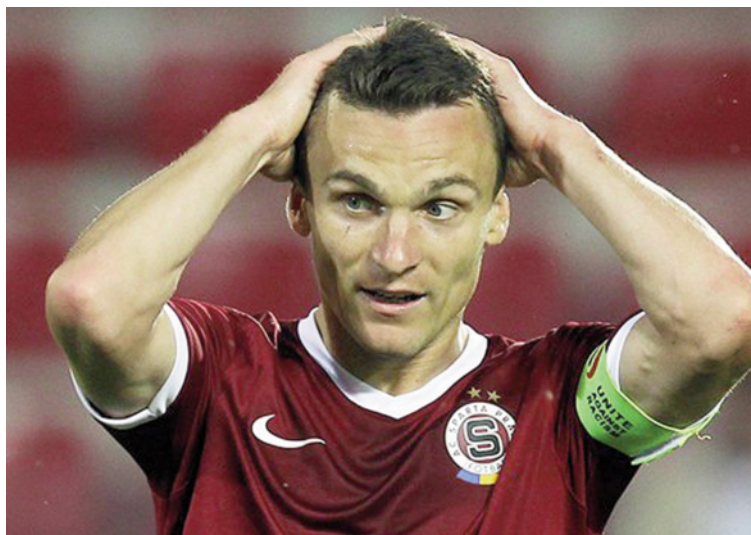
Illegální živnostník Lafata?

Lafata se sice odvolal ke kasačnímu soudu, moc šancí ale nemá. Chystá se ministerská novela, která by měla konečně zavést do sportovních peněz pořádek.