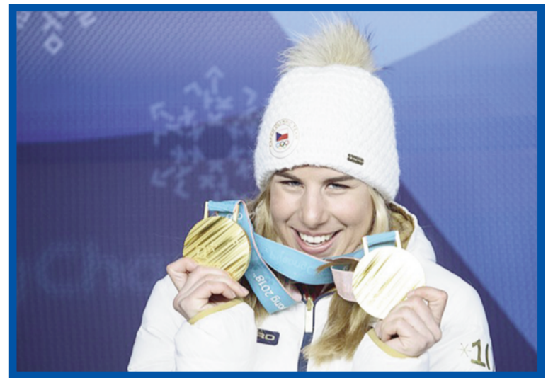
Ester přepsala historii Zeměkoule.