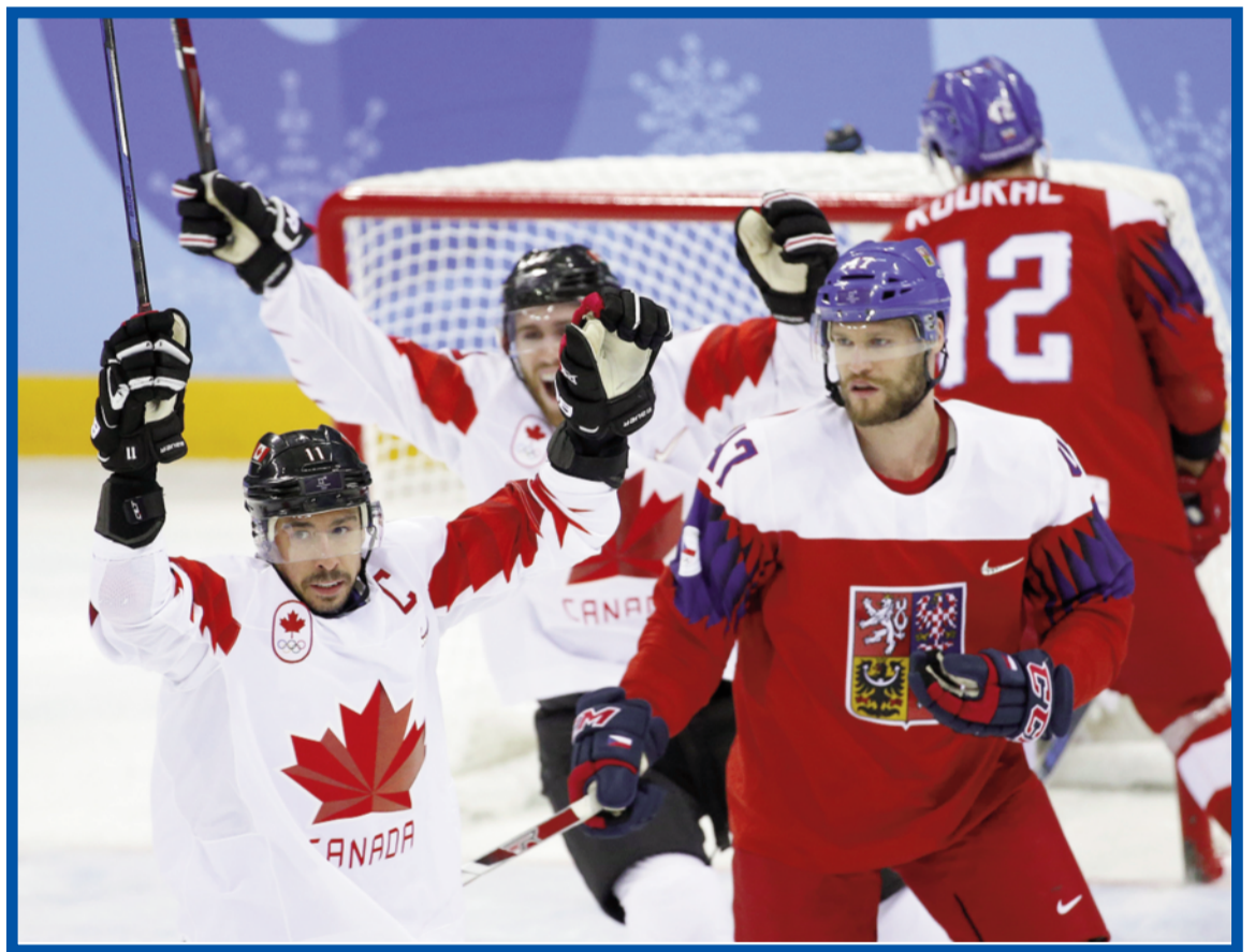
Češi si poplákali...