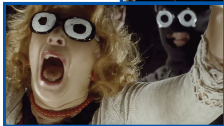
Jan Švankmajer a jeho Hmyz .