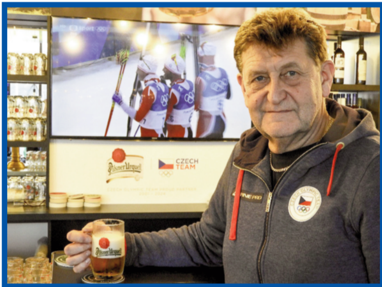
Pivečko je jako křen a chlba krásně voní, tak kdo by se plahočil v té zimě za medaili