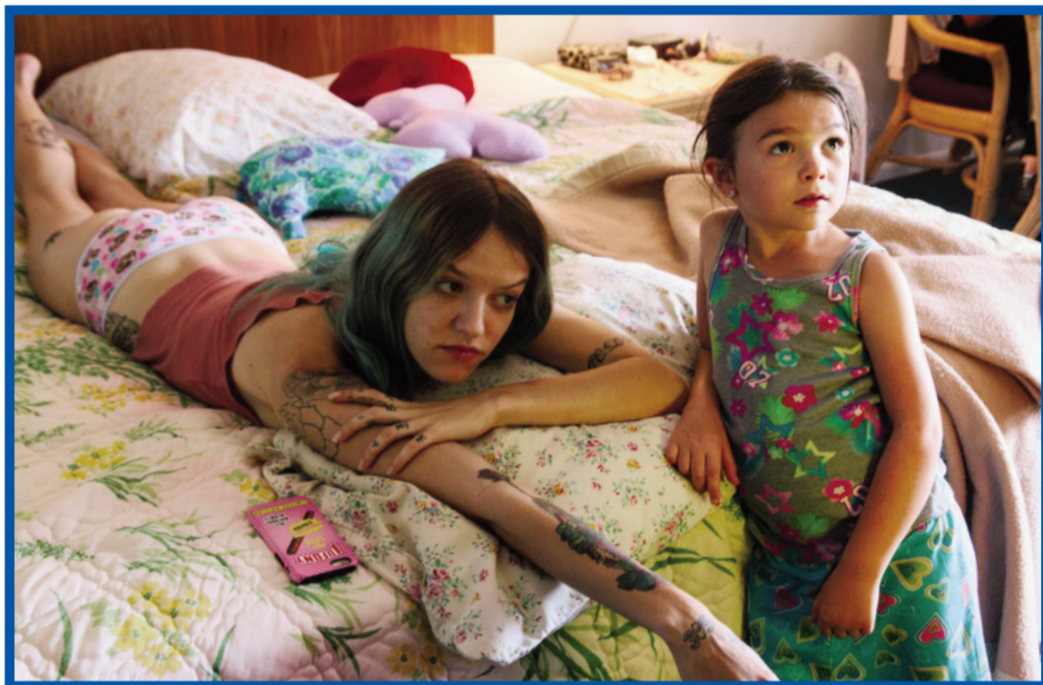
Záběr z filmu