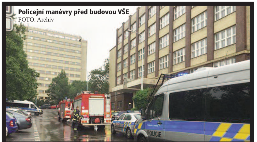
Policejní manévry před budovou VŠE

Policisté si díky předcházejícím zkušenostem již vědí se situací rady, a tudíž dokončili prohlídku areálu budovy na náměstí Winstona Churchilla už před třináctou hodinou. Stejně rychle postupovali na Jižním Městě.