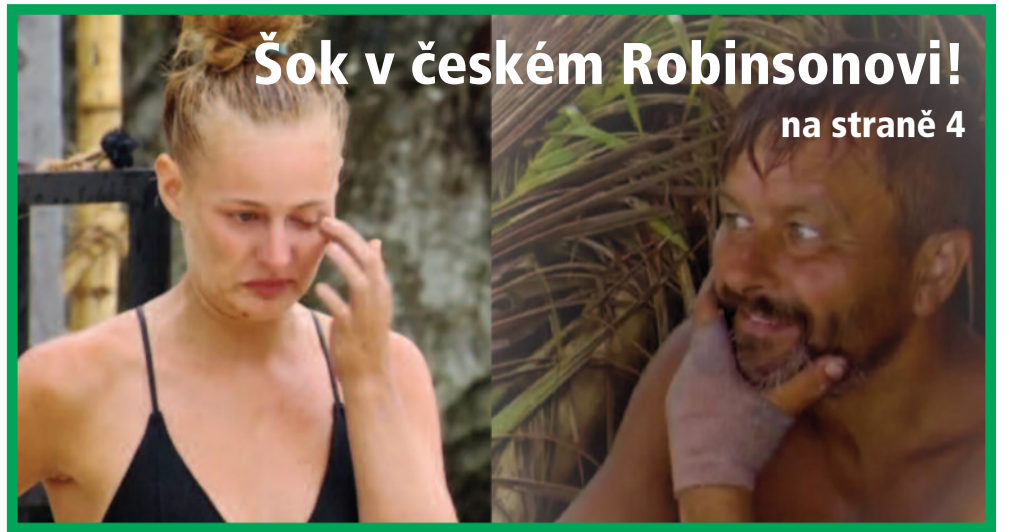
Šok v českém Robinsonovi!