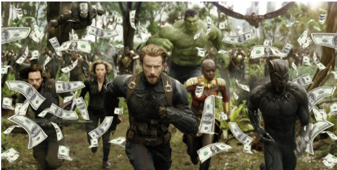
Nový snímek Avengers dosahuje rekordních zisků.

Unikátní zážitek umocňuje i profesionální využití astronomických rozpočtů, které jsou logickým důsledkem komerčního úspěchu celé série. Většina z 19 dosud uvedených filmů z MCU se automaticky stala nedílnou součástí moderní popkultury s širokým přesahem.