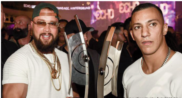
Vítězná dvojice rapperů Kollegah a Farid Bang

O antisemitismu se v současné době v Německu hojně diskutuje. V zemi totiž rapidně přibývá slovních i fyzických útoků na Židy. Židovská obec dokonce doporučila v zájmu bezpečnosti nenosit jarmulku na veřejnosti. Německé ministerstvo vnitra zareagovalo zřízením úřadu vládního zmocněnce pro boj s antisemitismem. Ten chce zřídit registr antisemitických zločinů. Největší problém totiž podle něj tkví v tom, že útoky na Židy jsou klasifikovány jako útoky pravicových extremistů. Většina napadení ale přichází ze strany muslimských přistěhovalců. Obzvláště radikální je podle něj muslimská mládež, kterou rodiče často vychovávají k nenávisti ke státu Izrael. Ta se pak projevuje šikanou židovských spolužáků.