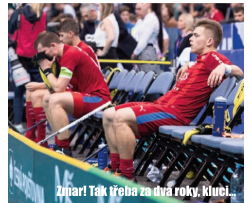
Zmar! Tak třeba za dva roky, kluci...