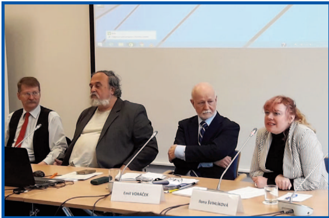
Konference v plném proudu