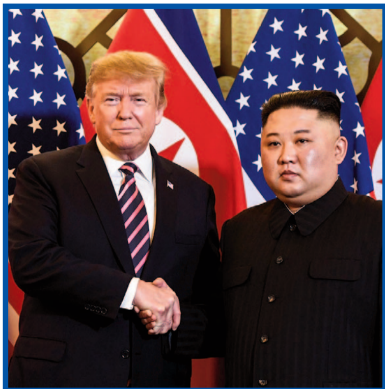
Donald Trump a Kim Čong-un