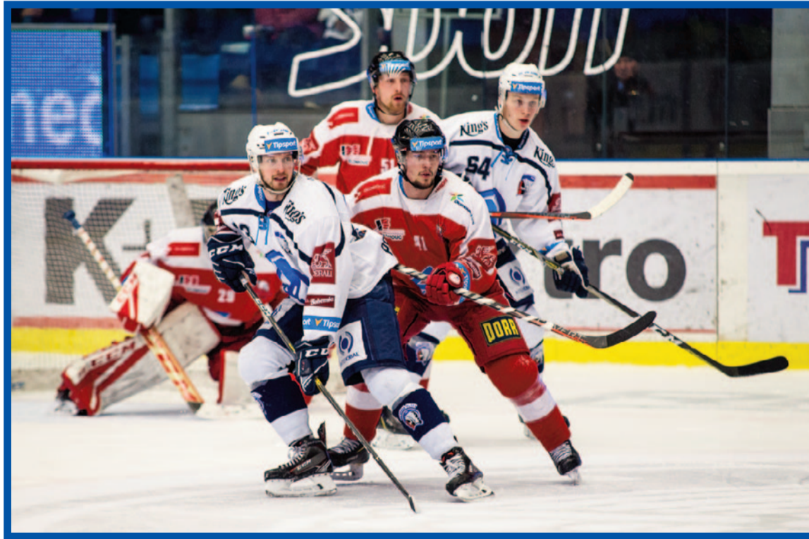
Odkud to přiletí?