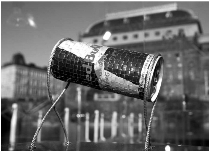
Vítězná plechovka Double Bull.