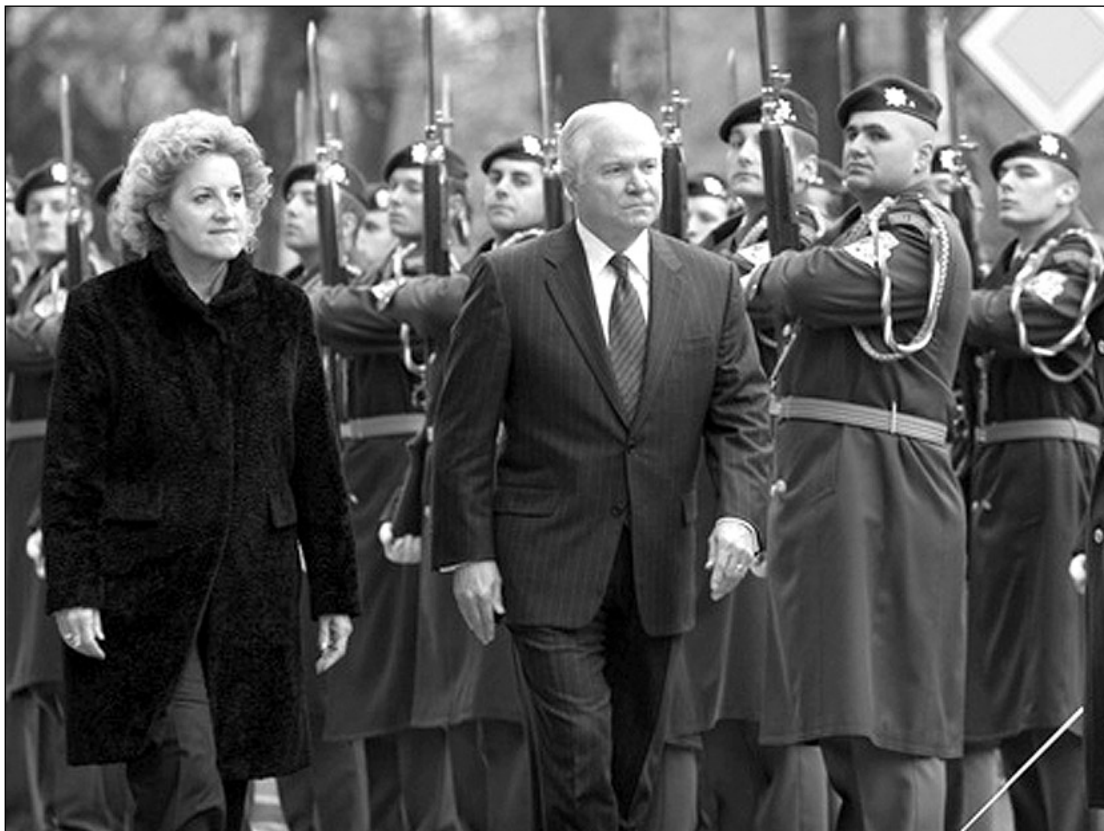
Ministři obrany Vlasta Parkanová a Robert Gates na úterní přehlídce čestné stráže v Praze.

Proti návrhu amerického ministra obrany Roberta Gatese včera ostře vystoupil místopředseda sně-