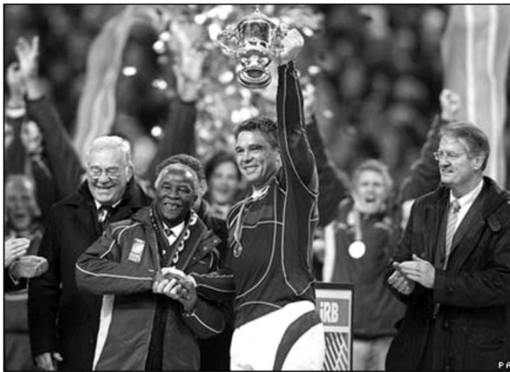
Prezident Jihoafrické republiky Thabo Mbeki gratuluje kapitánovi vítězného týmu.

V 15. minutě udělali Angličané další chybu a Montgomery poslal JAR znovu do vedení. Oba týmy pak pokračovaly v defenzivní taktice nakopávaných míčů, ale postupně začali získávat navrch Springbooks. Těsně před přestávkou se jim málem povedlo dostat míč až do