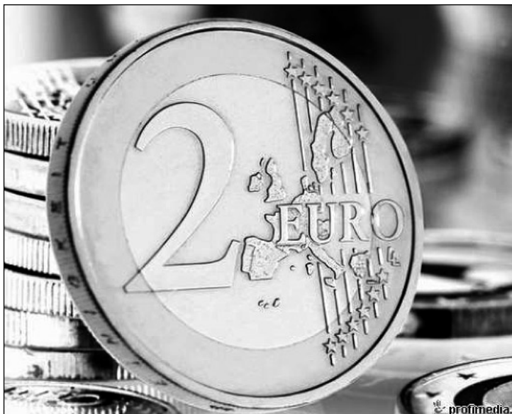
Dvě eura česká.

S vysokou inflací se bude pravděpodobně potýkat i Česko: „Kdybych měl učinit prognózu, České