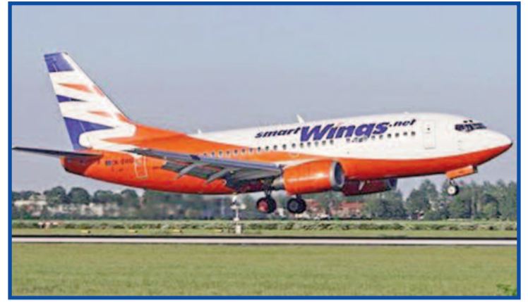
Letadlo společnosti SmartWings do Rumunska už nevystartuje.