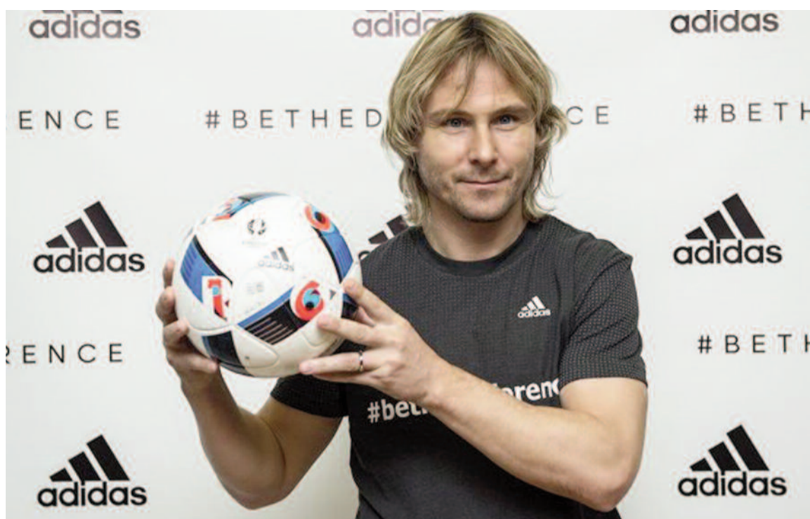
Pavel Nedvěd s míčem pro EURO

Zmínili jste českou ligu. Mluvíte se o tom, že byste se mohl někdy