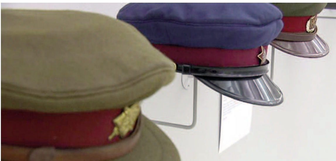
Umění ve službách budovatelské vlasti