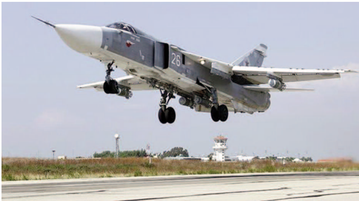
Stíhací bombardér Su-24.

Rusko ale jakoukoli vinu popírá. Stíhačka se podle Moskvy pohybovala kilometr jižně od hranice s Tureckem. „Jsou tam soustředění ozbrojenci, pocházející hlavně z Ruské federace,“ řekl Putin a okamžitě tuto akci označil za vážný incident, který může mít vliv na vztahy mezi Kremlem a Ankarou. Někteří poslanci dokonce volali po zrušení leteckého spojení obou zemí a akci nazývali teroristickým činem. Samotný turecký prezident Recep Erdoğan ale