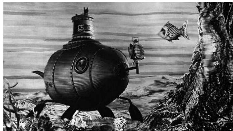
Z filmu Vynález zkázy