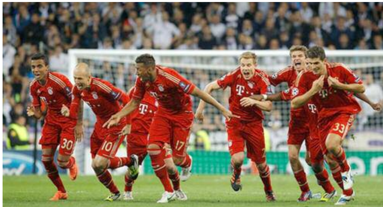
Fotbalisté Bayernu Mnichov se radují z postupu.