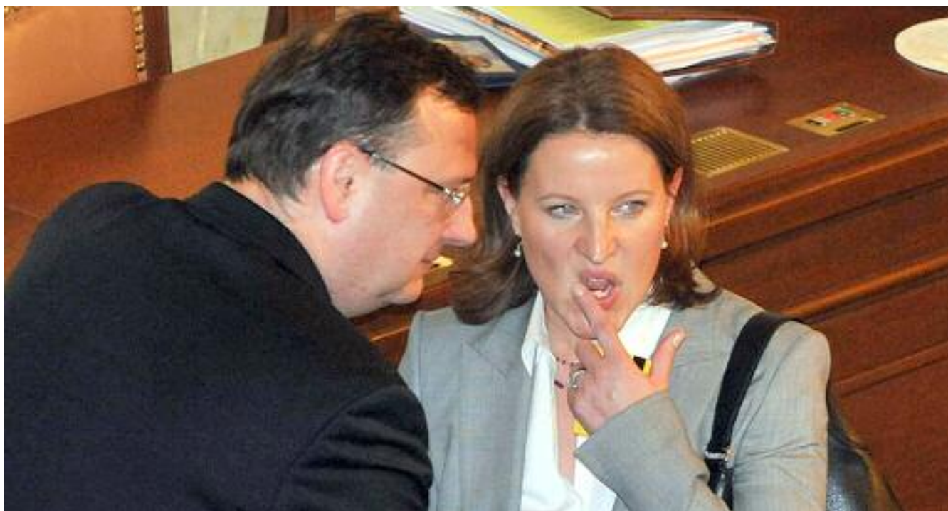
O osudu vlády se rozhodne v pátek.

Karolína Peake předminulý týden oznámila, že s Věci veřejnými