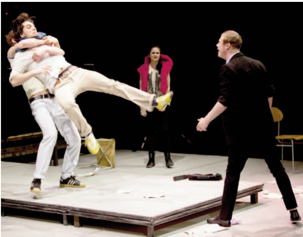
Punk a násilí na prknech.