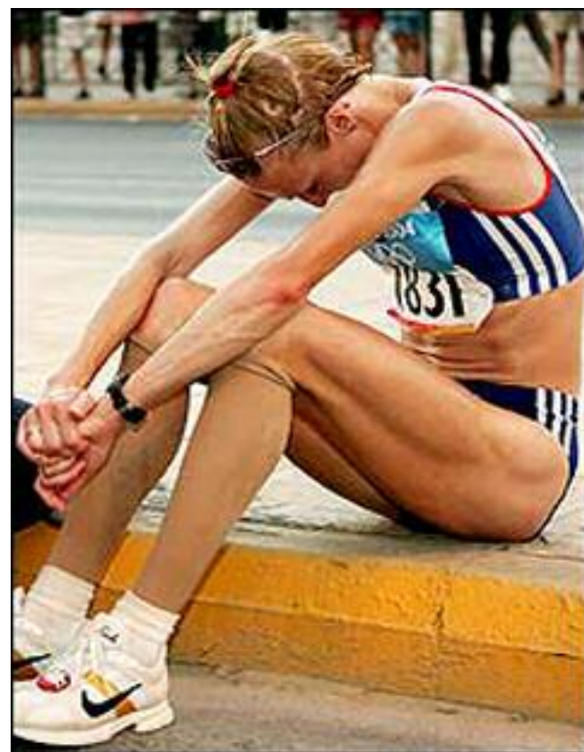
Zdrčená Radcliffeová v Athénách nedoběhla.