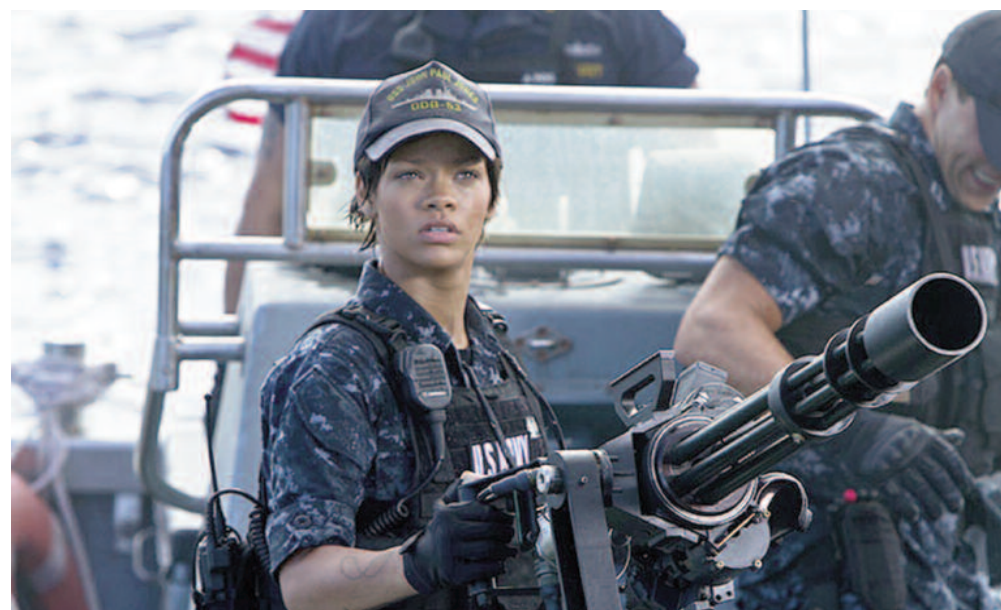
Rihanna ve filmu Bitevní loď.