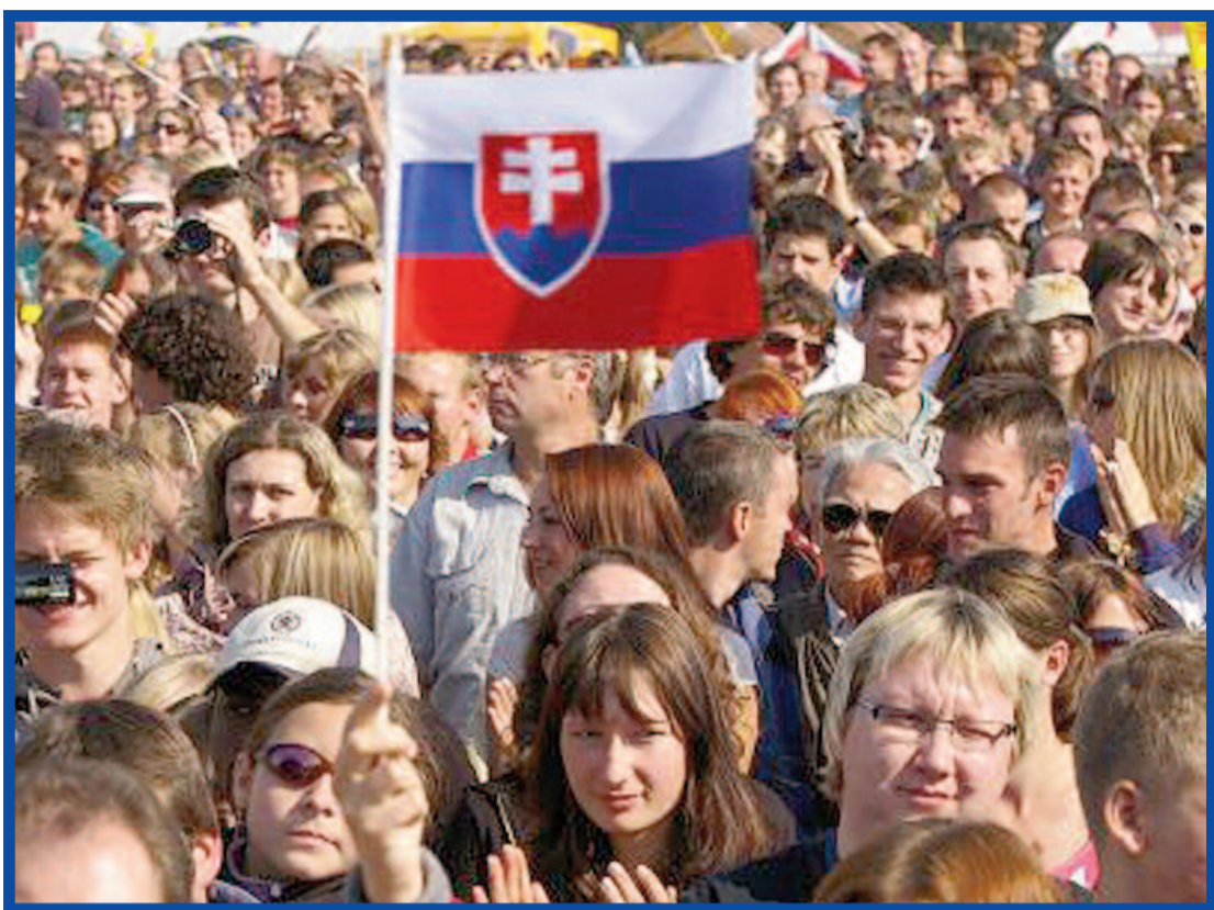
Zákon nařídí být vlastencem se vším všudy...