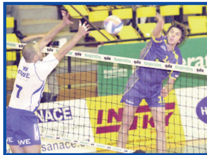
Základní část volejbalové extraligy vrcholí.