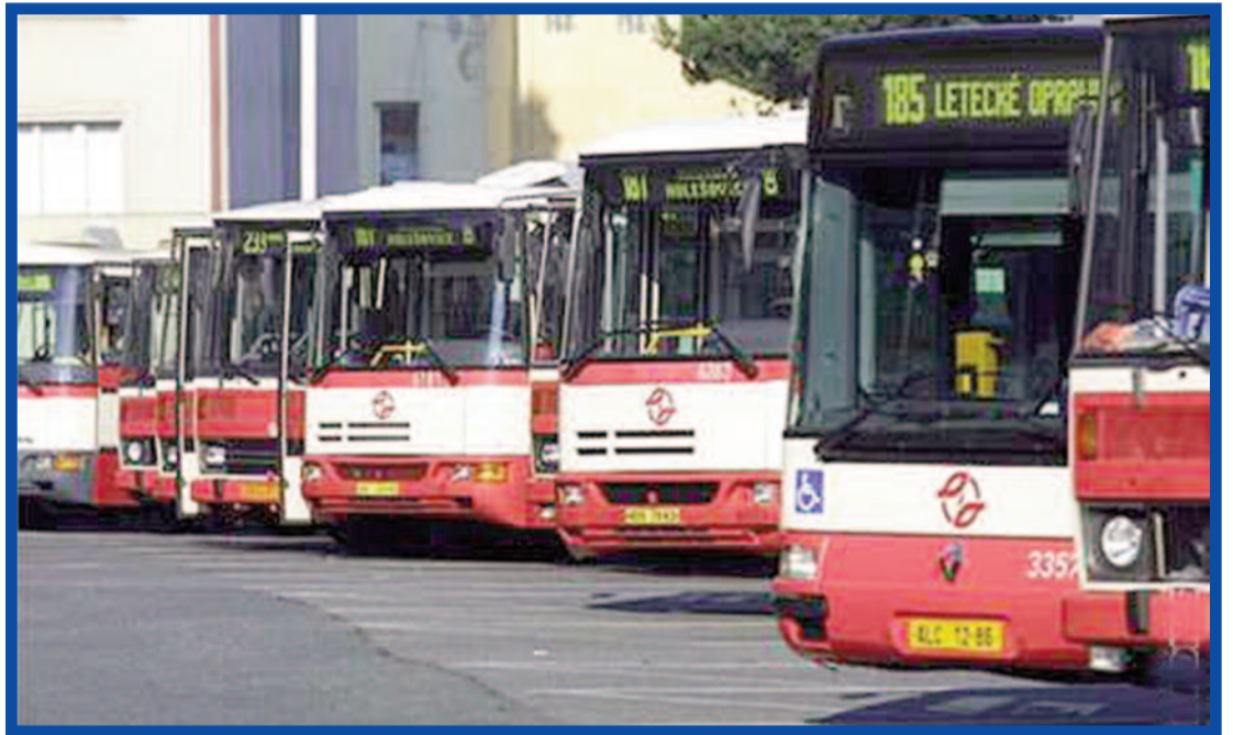
Stávka se nakonec nekonala, doprava fungovala normálně.