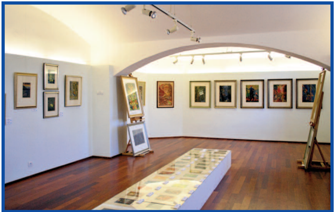
Výstavní síň Ve víru temnot

Výstava na první pohled zaujme barevnou i námětovou pestrostí navzdory tomu, že se jedná o díla pouze z několika tematických okruhů. V každém z nich lze totiž najít naprosto odlišný náhled na svět, který autora obklopuje, a zároveň zcela subjektivní odraz jeho osobnosti. Přestože se Váchalovy dřevoryty vyznačují obdivuhodnou řemeslnou zručností, jejich hlavní kouzlo tkví v mistrném zvládnutí barev. I když se návštěvník možná ztratí v nepřehledném množství ex-