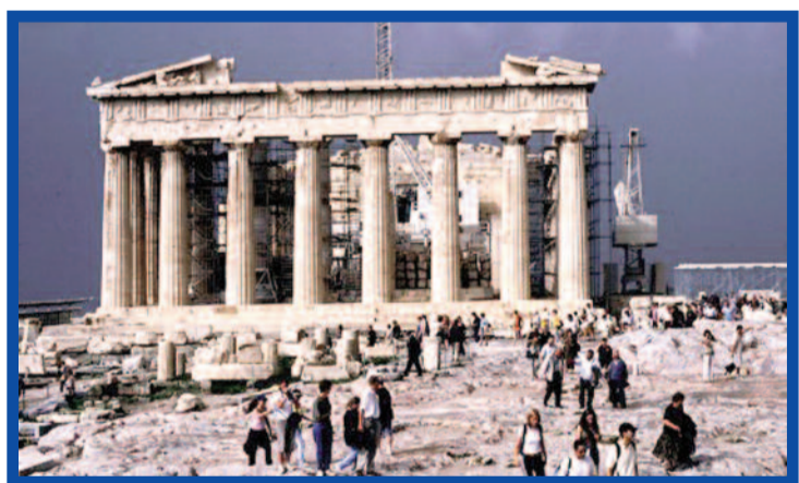
Řeckové upínají zrak k vládním krokům.