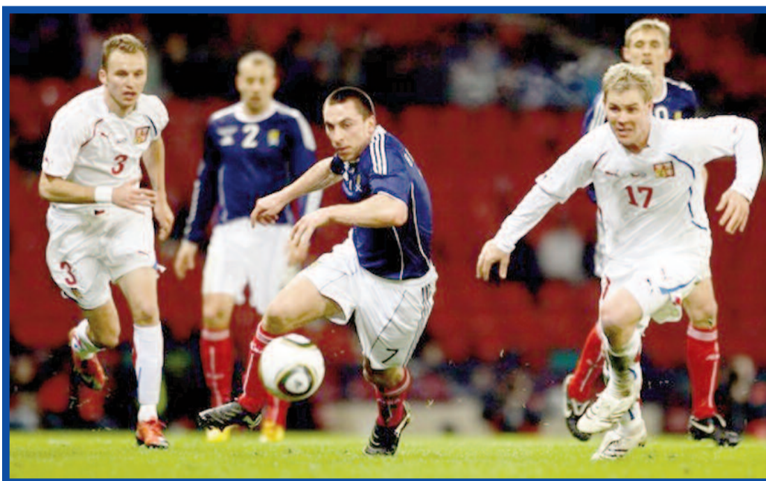
Naši občas jen přihlíželi...