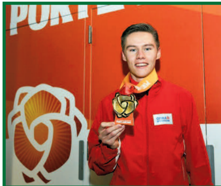
Halový mistr světa Pavel Maslák.