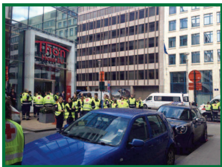
Hotel Thon se stal provizorní ošetrovnou pro zraněné.

V České republice byl vyhlášen první stupeň ohrožení terorismem. Podle webu ministerstva vnitra první stupeň „upozorňuje na existenci obecného ohrožení terorismem vyplývající ze situace v zahraničí nebo mezinárodních aktivit České republiky, zároveň ale není známa konkrétní hrozba