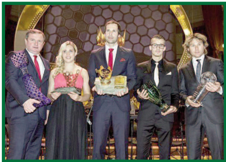
Letošní vítězové ankety.