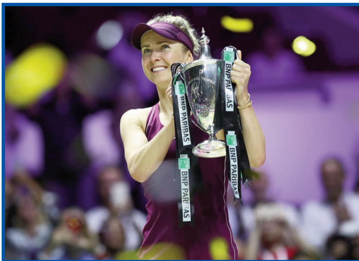
Svitolinová slaví životní triumf.