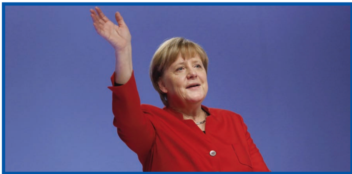
Merkelová se loučí s CDU