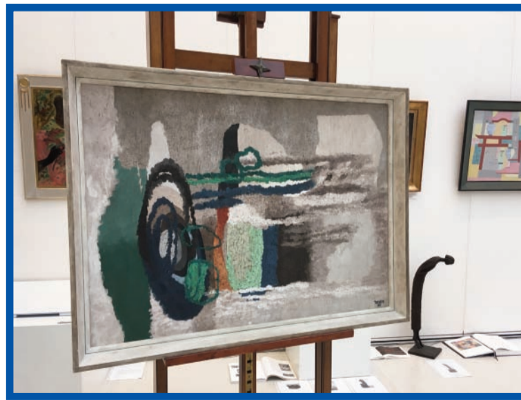
Hlavním lákadlem aukce byly Čedičové skály od Toyen.