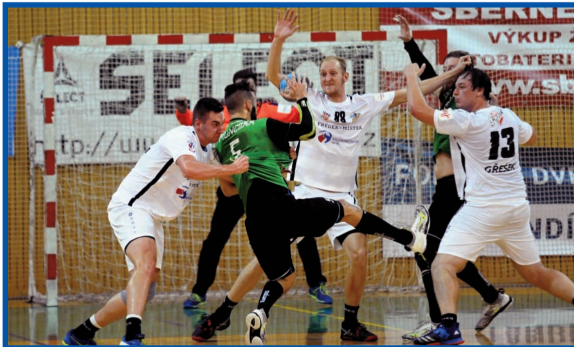
Monczka pomohl svému týmu šesti góly.

Stejně tak se z vítězství radovaly i Hranice, které v zápase o třetí místo v tabulce porazily Sokol Nové Veselí. To z velmi vypjatého zápasu vyšlo bezbodově a utrhlo tak první prohru na domácí palubovce. JITKA HOLUBOVÁ