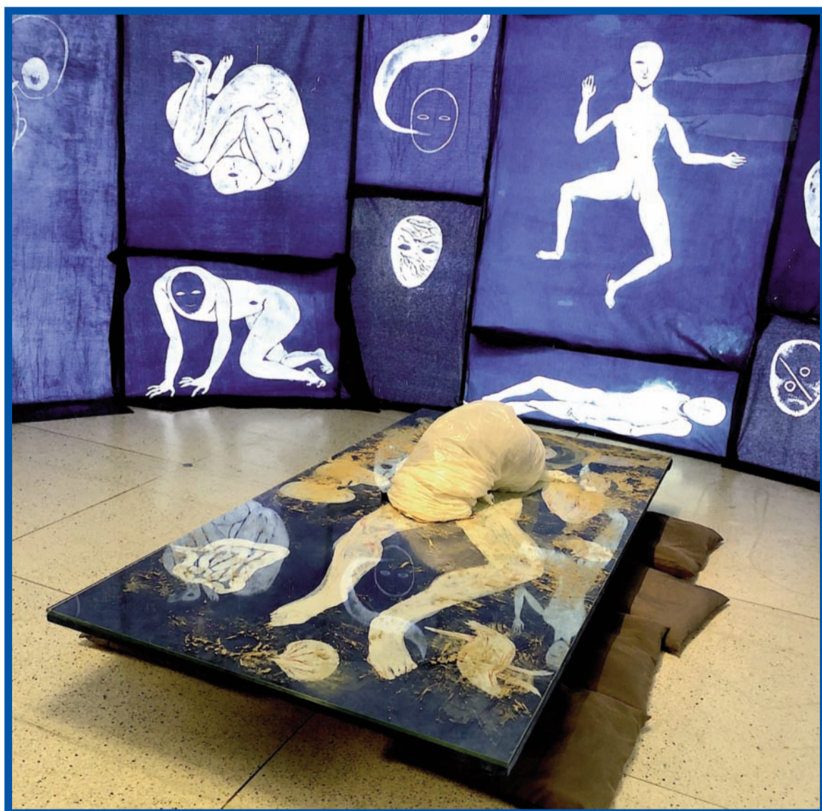
Modrotisk na látce a keramická hlína od Adély Součkové