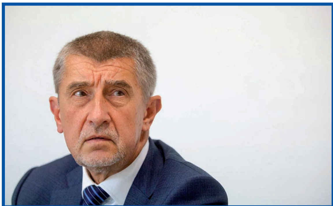
Premiér Andrej Babiš