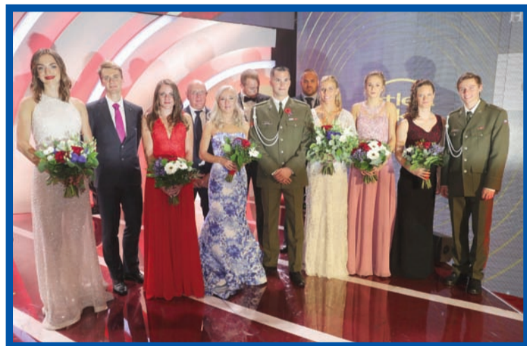
Dvanáctka oceněných atletů