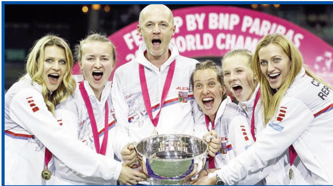
Radost. Zase je do čeho nalít šampus.