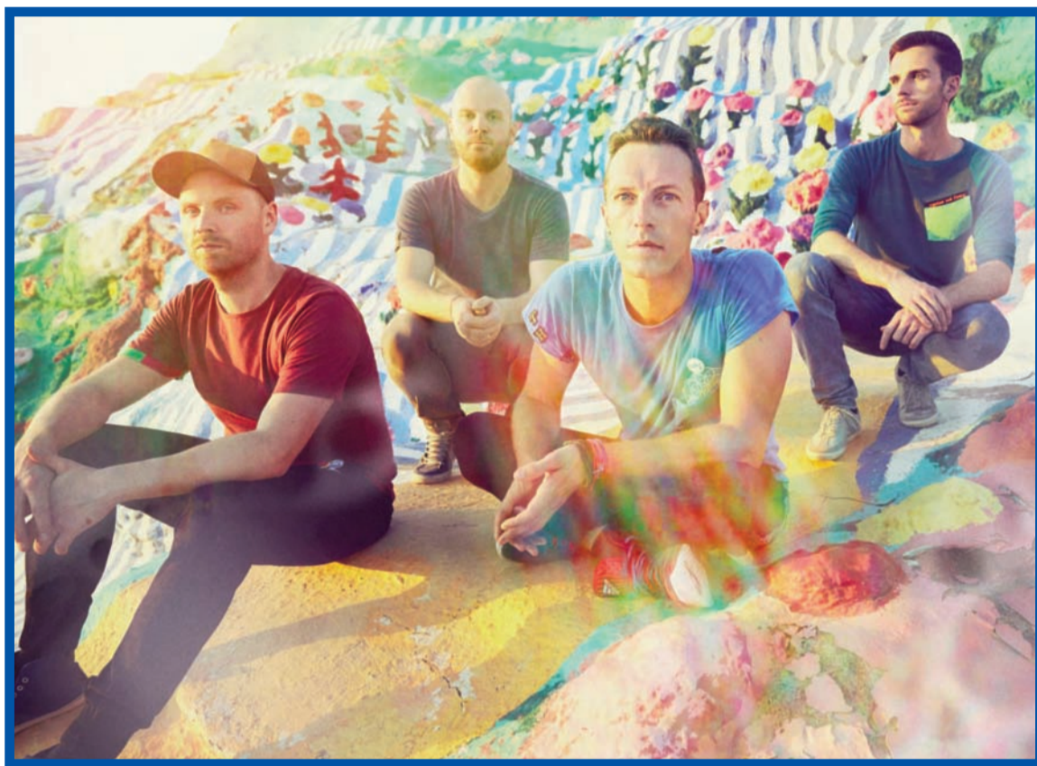
Foto z turné A Head Full of Dreams